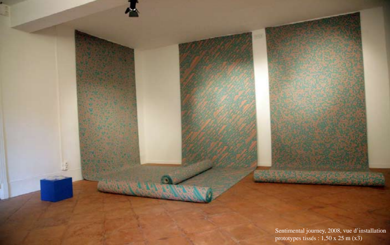
Sentimental journey, 2008, vue d'installation prototypes tissés : 1,50 x 25 m (x3)