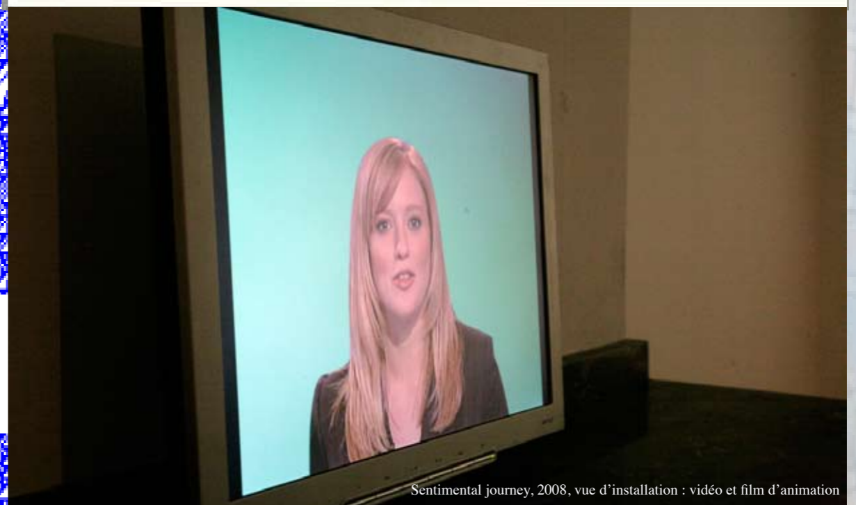
Sentimental journey, 2008, vue d'installation : vidéo et film d'animation