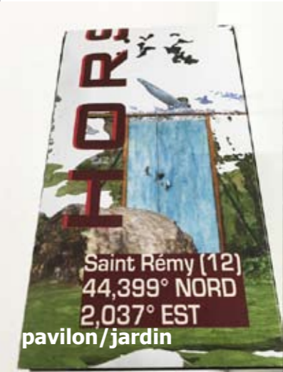
Saint Rémy (12) 44,399° NORD 2,037° EST pavillon/jardin