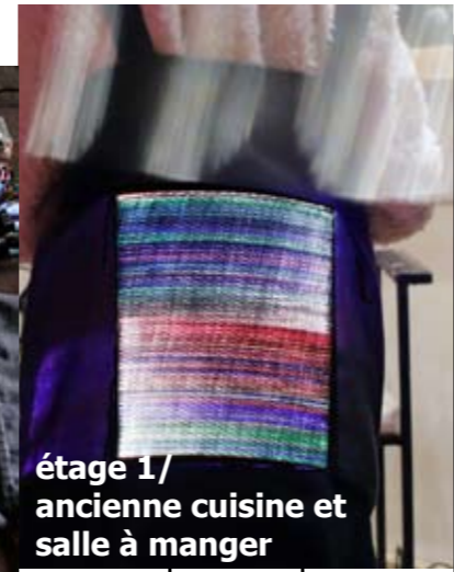
étage 1/ ancienne cuisine et salle à manger