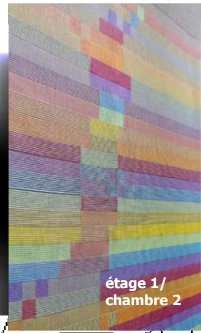
étage 1/ chambre 2